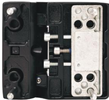
Vista Interior - FD145